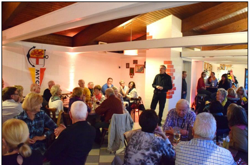
Unser Präsident bei der Begrüßung der Mitglieder