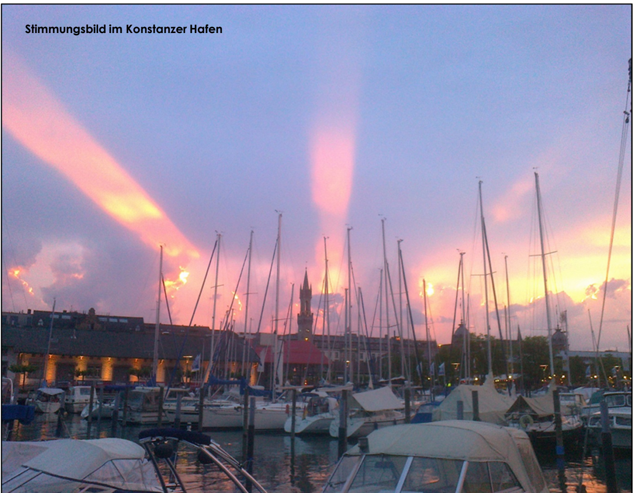
Stimmungsbild im Konstanzer Hafen