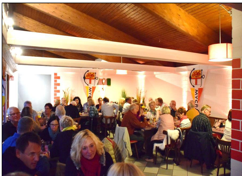
Das Vereinsheim im Markelfingen ganz im Zeichen des MYCR

Alle ausgedruckten Berichte wurden im Original übernommen