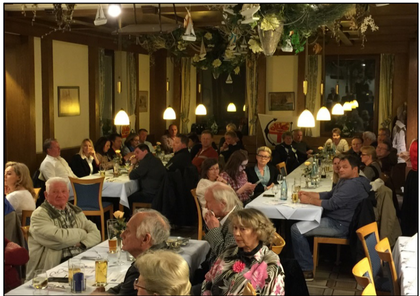
Hauptversammlung im Restaurant Schiff, Moos

Womit wir auch gleich beim Thema NR.1 für uns Motorbootfahrer wären, das Wetter, ein wesentliches Kriterium für uns Bootsfahrer. Denn es sollte sich natürlich stets von seiner besten Seite, also Sonnenschein pur, zeigen, damit wir das Bootfahren genießen können. Da wurden wir in der vergangenen Saison mehr als nur verwöhnt, denn ein so gutes Wetter über einen so langen