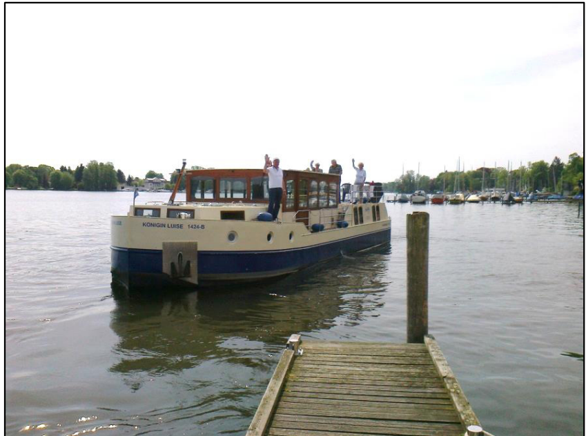
Die Welt ist klein, Radolfzeller trifft man überall