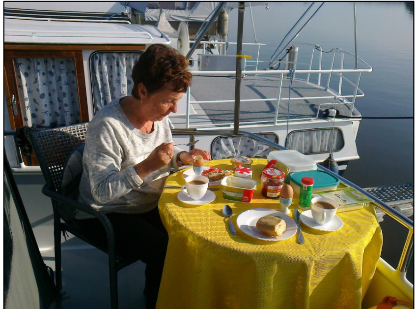
Frühstück auf der Elke bei Sonnenschein und Frühstücksei

Mittwoch 13.05.15: Abfahrt 10:10, wieder zurück über Plauer See, ( die Brandenburger Niederhavel ist schöner, idyllischer, aber wir kannten sie schon ). Über die Vorstadtschleuse Brandenburg , nach Ketzin, Ketziner Seesportclub. Ankunft 14:30, 32,1 Km., Wetter Leicht bewölkt, schön.