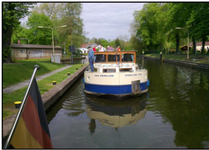
Schleuse neue Mühle

ab Plauer See, Kirchmöser Eisenbahner Segelverein. Ankunft 15:30, 62,4 Km., Wetter leicht bewölkt, schön, abends Gewitter. Gaststätte Fischufer, wie immer war das Essen sehr gut. Spaziergang zum Einkaufen bei Netto.