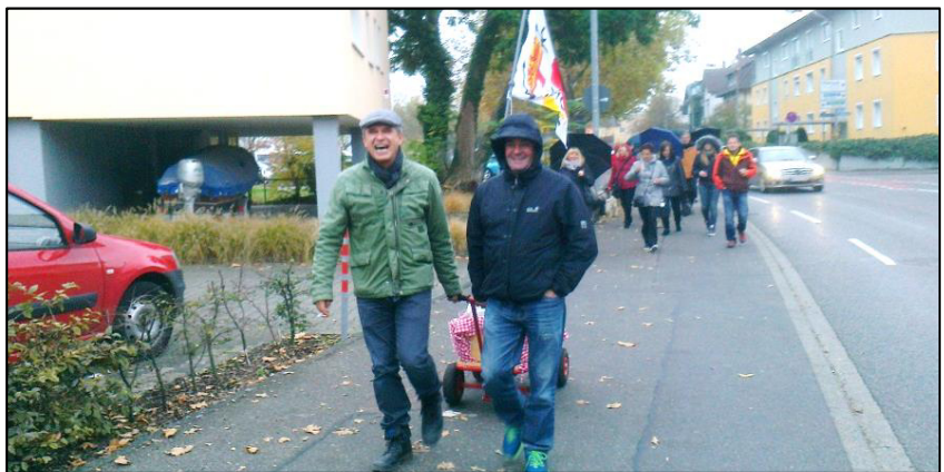
Start am Messeplatz

einander mit dem Auto. Wie bei allen Veranstaltungen gab es auch hier einen harten Kern zu beobachten. So waren einige Damen und Herren der Meinung SIE müssten das Licht in der Kneipe ausschalten.