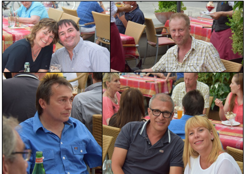
Zufriedene Mitglieder nach einem schönen Tag auf dem Wasser