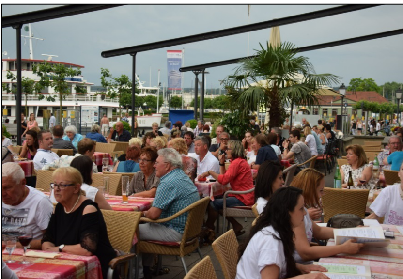
Der MYCR beim Abendessen im Konzil auf der Terrasse

Als einige (Damen) sich „stadtfein“ gemacht hatten, stand ein kleiner Stadtbummel auf der Tagesordnung. Es ging nicht lange, da verschwanden sie in einer Boutique und kamen nie wieder raus. Die Herren ließen es sich dann bei einem Eis gut gehen, sie hatten ja keine andere Wahl.