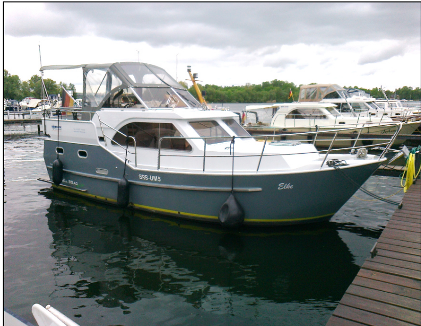
Unsere Charteryacht „Elke“ für 14 Tage rund um Berlin