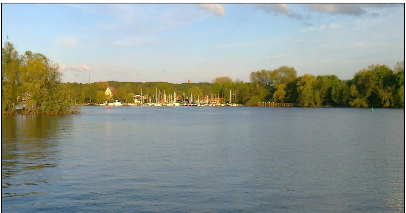
Sicht auf Potsdamer Yachtclub