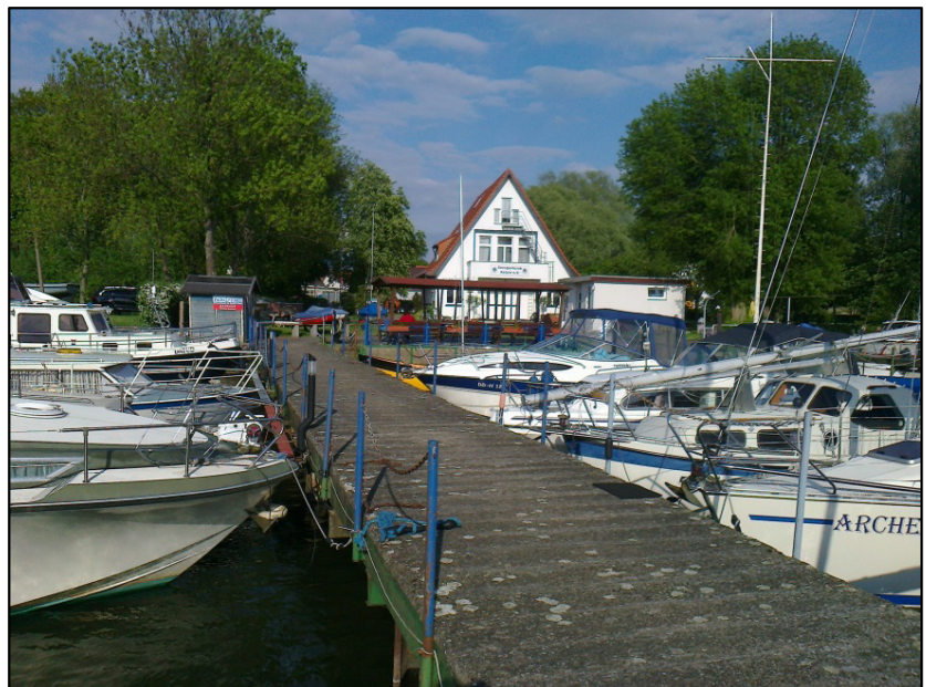
Hafen Ketziner Seesportclub.

Km 22, Durch Schlänitzsee, bis Wasserkreuzung Km 32, das heißt 10 Km., mit Geschwindigkeit 6 Km/h. Es wäre schneller über die Potsdamer Havel gegangen. Weiter über Trebel See, die Havel bis Vorstadtschleuse Brandenburg, Hub 1.0 mtr., Silokanal, Quenzsee, rechts