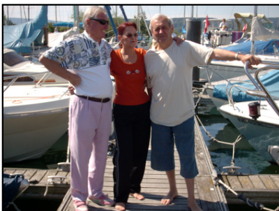
MYCR-Mitglieder treffen sich gerne auf dem Steg

Jeder von uns hat schon irgend ein unschönes Erlebnis mit dem Boot auf dem See erlebt. Ich spreche jetzt generell das Prozedere mit nicht mehr laufenden Motoren an. Die Umstände sind dann ja meistens nicht gerade optimal. Wetter schlecht, Regen, Wellengang und eine gewisse Aufregung. Trotzdem sollte man jetzt den kühlen Kopf behalten. Was in diesem Falle sehr wichtig ist, bedeutet dass man ein wenig über die Motortechnik bescheid weiß. Also man versucht zuerst wieder den Motor zu starten. Wenn der Anlasser kräftig durchdreht, aber den Motor nicht zum Laufen bringt, dann heißt das zunächst, dass die Batterie in Ordnung ist.