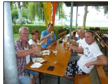
Fröhschoppen im Freibad