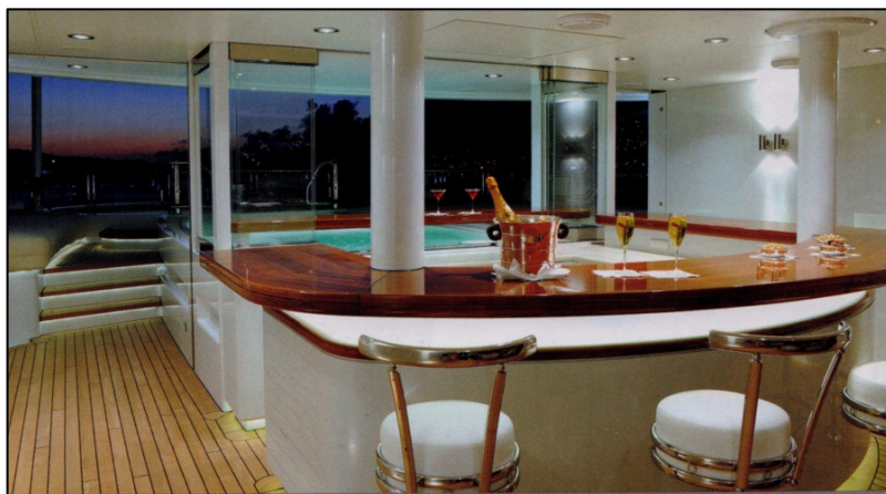
Einer der Whirlpools mit Bar