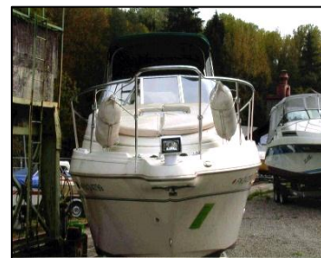
Neues Boot von vorne

damit was richtiges Anfangen kann und einer kleinen Küchenzeile mit Spülbecken und sogar mit einer separaten Toilette ausgestattet. Was für ein Luxus, wenn man bedenkt dass er vorher nur eine Sitzbank und ein Lenkrad hatte, in der Größe wie der Steuerstand auf seinem neuen Boot und von der Liegefläche wollen wir hier an dieser Stelle gar nicht viel erzählen, sondern lassen uns überraschen was uns da nächstes Jahr drauf geboten wird. Mit dem neuen Boot eröffnen sich wie gesagt viele neue Möglichkeiten für die Zukunft im Hause Villwock und macht auch seiner Frau das Leben an Bord wesentlich einfacher, wenn es um die Versorgung mit Getränken und Essen geht.