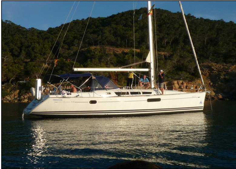
Die gecharterte Sun Odyssey 44i

Als überzeugter Motorbootfahrer war die Einladung zu einem 1-wöchigen Segeltörn rund um Ibiza schon von Beginn an verlockend. Es war für mich die Chance als Crewmitglied in die Welt der Segler eintauchen zu können. Ich hatte auch Respekt vor der Gewalt des Meeres und meine Zweifel, ob die Crew das Leben und die Anforderungen an Board ohne große Spannungen meistern würde.