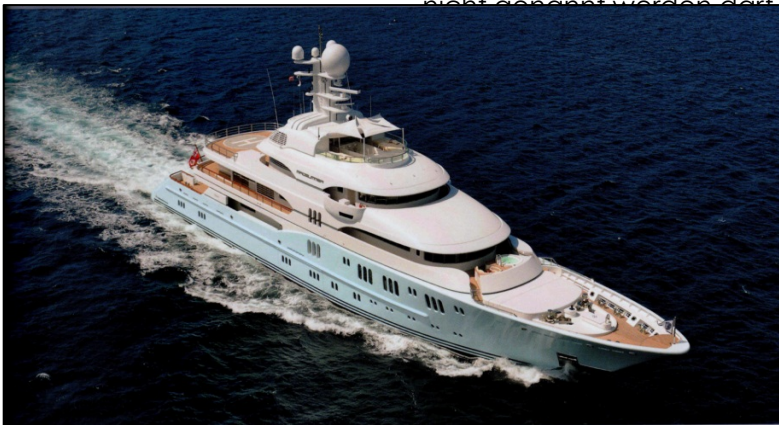
Das ist mal eine Yacht .....

Was die Ausstattungen angeht ist das Leben an Bord sicher nicht geprägt von Entbehrungen, denn vom Hubschrauberlandeplatz bis zu mehreren Swimmingpools auf den unterschiedlichen Decks bzw. in den einzelnen Kabinen fehlt dem geneigten Passagier nichts um seinen Aufenthalt so angenehm wie möglich zu gestalten. In dieser Yacht wurden alle Kabinen mit Mediatechnik wie Superflat – TV und Soundsystemen ausgestattet, die in ihrer Gesamtheit soviel Strom verbrauchen, dass ein zusätzlicher Generator