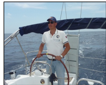
Als Steuermann unter Motor mit MYCR-Mütze !

Die restlichen Tage hatten wir meistens Windstärken zwischen 4 und 6 Beaufort, das war für einen Einsteiger wie mich sehr angenehm. Großen Respekt gegenüber dem Skipper hatte ich beim Training eines Mann-über-Board-Manövers. Bei ca. 2 m hohen Wellen hat es