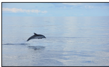
Delphine begleiten uns

die Fahrt über das offene Meer nach Ibiza, das sind ca. 65 Seemeilen oder ca. 90 Kilometer. Wir hatten kaum Wind, was mir zu Beginn des Törns nicht unrecht war. Bei der Überfahrt sah ich zum ersten Mal in der Freiheit lebende Delphine, eine beeindruckende Begegnung.