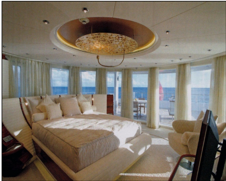
Eine der Eignerkabinen

mit einer zusätzlichen Leistung von 1200 KVA nur für diese Multimedia -komponenten eingebaut werden musste. Übrigens sind auch im Außenbereich überall TV in den Decken eingebaut, die elektrisch ausgefahren werden können. Weitere kleine Besonderheiten sind die beiden Pools mit Gegenstromanlage, sechs Waterbikes sowie mehrere Tauchausrüstungen, die an Bord jedem Gast zur Verfügung stehen. Weiteres Highlight auf dieser Yacht, die von 35 Besatzungsmitgliedern bedient wird, ist eine Lounge im Inneren des Schiffs mit einem Glasboden im Rumpf, bestehend aus 26 cm dickem Glas, das aus 15 Lagen Spezialglas zusammengesetzt wurde und durch das die insgesamt 36 Gäste die maximal an Board beherbergt werden können, die Unterwasserwelt bestaunen können. Speziell entwickelte Glasfaserlampen, die unterschiedliche Lichtreflexe erzeugen können, sollen dabei helfen die unterschiedlichsten Fische