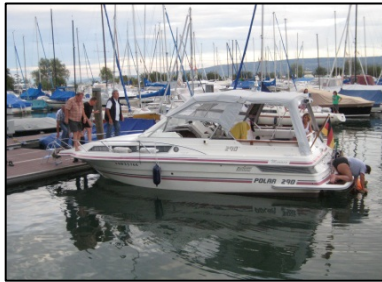
Entsperrung der Sicherung

Das es viele Neider gibt, die uns Bootsfahrern ihr Hobby neiden, ist schon lange bekannt und so manches Boot wurde schon von gemeinen Dieben gestohlen, was uns Bootsfahrer zu immer ausgefeilten Methoden der Diebstahlsicherung bringt. Eine ganz besondere wollen wir hier aufzeigen, da sie bei anerkannten Experten als besonders sicher gilt.