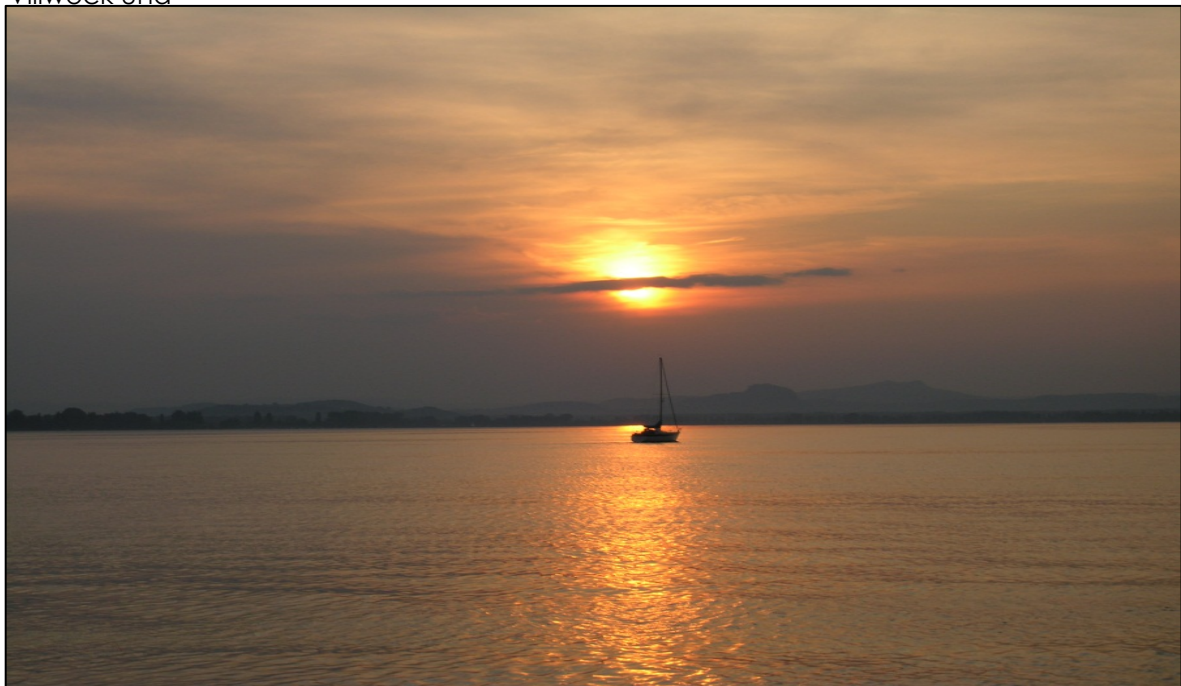
Abendliche Stimmung auf dem Zellersee mit dem Hegau im Hintergrund