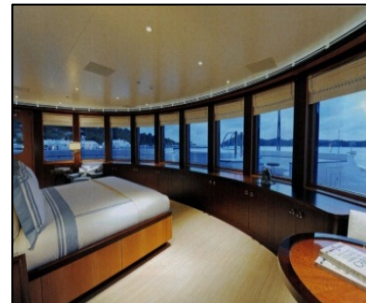
Das Schlafgemach des Eigners

Herrschaften in den Sinn kommen. Dass Geld dabei eine eher untergeordnete Rolle spielt ist klar. Auf meine Fragen, was denn so eine Yacht kostet, hüllen sich die Herren in vornehmes Schweigen und lediglich der Preis von 1 Mio. € pro Meter Schiff in der Standardausstattung wurde da mal preisgegeben wobei eigentlich niemand „Standard“ kauft. Angesichts solcher Summen werden selbst die für uns teuer erscheinenden Windy Boote zu Beibooten degradiert und fristen dann ihr Dasein in den Bootsgaragen dieser Yachten. Hier nun ein Paar Daten und Fakten von einer Yacht dessen Eigner hier nicht genannt werden darf.