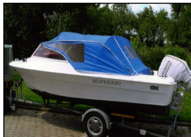
Das alte Boot

Wer sein altes Boot kannte weiß, dass es nicht geeignet war, darauf zu über-nachten oder gar mehrere Tage zu verbringen, so dass er bei unseren Ausfahrten immer