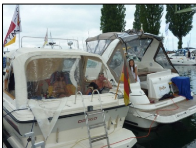
Päckchen mit MYCR-Wimpel

Viele nutzten damit den Sommertag nach der Abreise für ein erfrischendes Bad im See, vor oder während der Rückreise in den Untersee.