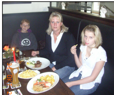
Gewinnerin des Hauptgewinns 2010 beim Einlösen des Essengutscheins im Goldenen Engel in Radolfzell

„Großen Ausfahrt“ los. Wir werden das lange Wochenende über Christi Himmelfahrt nutzen und uns in den Obersee aufmachen. Am Hauptabend am Samstag wird gemeinsam in Konstanz gefeiert. Die zweite Ausfahrt im Juli führt uns nach Uhdingen. Wenn ich an die lustigen Stunden bei den letzten Ausfahrten denke, hoffe ich, dass möglichst viele Mitglieder sich die Zeit nehmen und an den Ausfahrten teilnehmen. Wie gewohnt werden wir Hafentische, Restaurant und schönes Wetter für euch organisieren.