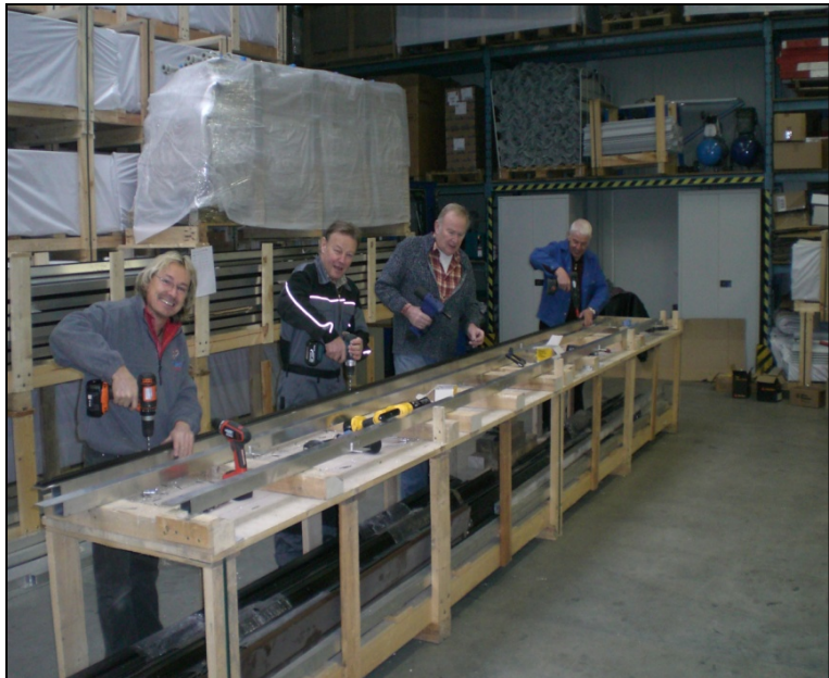
Das Topsteam bei der Arbeit

Planken anzuschrauben, komplett frei zu halten von den Stegbauarbeiten, was zum einen für die Gäste des Hafens gut war, weil diese nichts vom eigentlichen Umbau mit bekommen oder gar darunter leiden mussten und zum anderen für uns, den Ausführenden, genug Zeit zum Boot fahren blieb. Es wurde also auch im Winter fleißig für den Steg gearbeitet, um so wichtige Zeit für den Sommer herauszuholen und die im Hafen zu erledigenden Arbeiten weitestgehend zu vereinfachen und zu minimieren. Wie sagte mal ein kluger Mann: