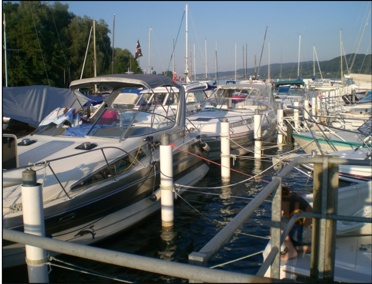
Boote über Boote, soweit das Auge reicht