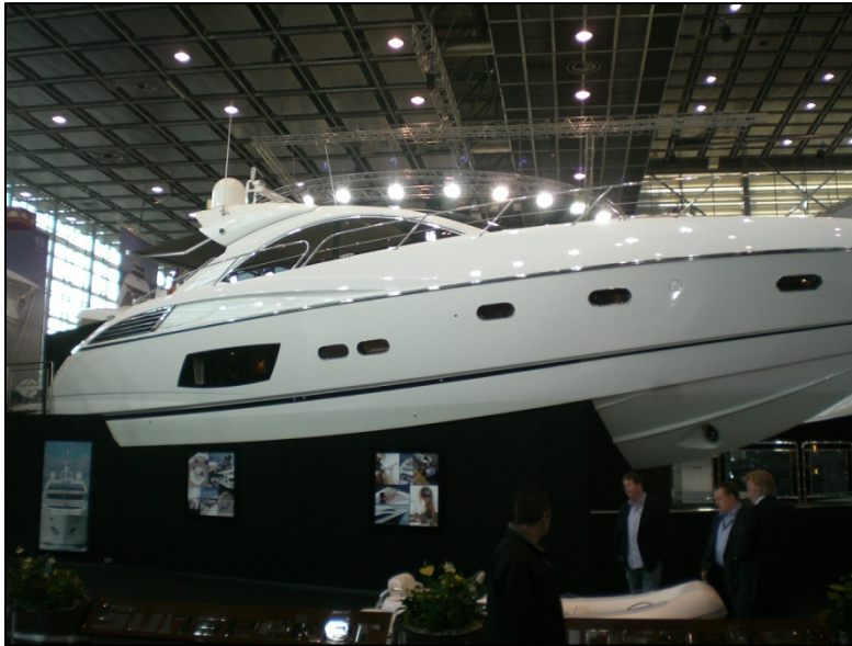
So sehen die neuen Formen aus

Bootsmessen und Ausstellungen sind, wie jeder weiß, für uns Bootfahrer immer ganz besonders interessant. Nicht nur weil man hier all das ansehen kann, was man sich sowieso nie leisten kann, sondern in erster Linie weil man hier ganz klar erkennen kann in welche Richtung sich die Boote entwickeln, welche Trends sich durchsetzen und vor allem welche neuen technischen bzw. design-technischen Neuerungen es so gibt.