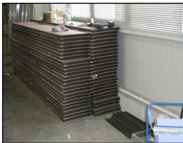
Die Module für die Ausleger

Weise belegt werden konnten ohne Gefahr zu laufen, dass dabei jemand ins Wasser fällt. Deswegen wurde kurzerhand beschlossen, die Belegung der Seitenausleger in Modulen (passend auf die vielen unterschiedlichen Maße der Ausleger) vorzufertigen, so dass diese fertigen Module nur noch in den Ausleger eingeschoben werden mussten. Diese Fertigung der Module wurde im Winter 2009/2010 wieder von der alt bekannten Truppe erledigt, so dass bereits Ende 2010 alle Ausleger vom A- und B-Steg mit dem neuen Belag fertig gestellt werden konnten. Somit sind also die beiden Stege komplett fertig und alle Kräfte können sich 2011 auf den noch ausstehenden C-Steg konzentrieren, der wie allgemein bekannt ist alleine so lang ist wie der A- und B-Steg zusammen dafür aber keine Ausleger hat. Besonders erfreulich ist die Tatsache, dass man es im letzten Jahr geschafft hat, die Hauptsaison, in der wir ja alle bei schönem Wetter lieber mit den Booten über See fahren anstatt im Hafen neue