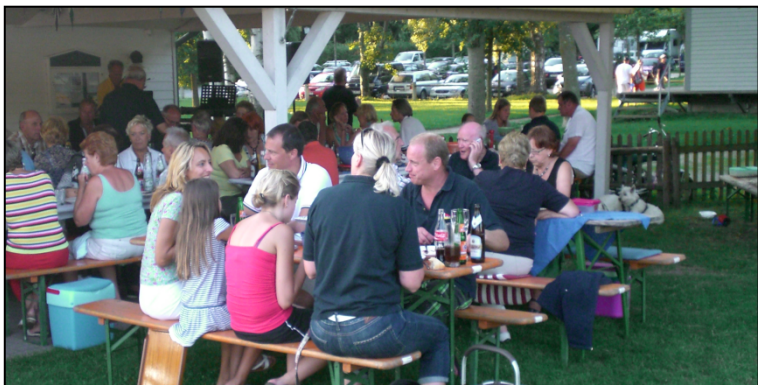
Unsere Mitglieder des MYCR beim gemütlichen Beisammensein

Am folgenden Morgen traf sich der Großteil der Teilnehmer zu einem gemeinsamen Frühstück mit anschließendem Fröh-schoppen. Auch an diesem Sonntagmorgen hatte der Wettergott ein Einsehen und sorgte an diesem Tag für traumhaften Sonnenschein. Viele nutzten die sommerlichen Temperaturen auch zu einem erfrischenden Bad im See. Es