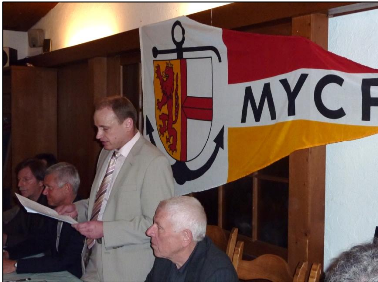
Unser Präsident im Einsatz

Bei absolutem Traumwetter während der WM startete unsere große Ausfahrt im Juli in den Obersee. Höhepunkt war der Hauptabend in KN-Staad. Gutes Essen, kühle Getränke, schöner Ausblick was will man mehr??? Ebenfalls bei schönem Wetter fand die Ausfahrt des