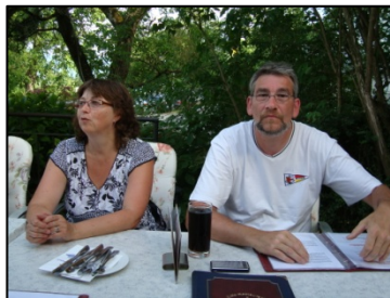
Ein gezeichneter Organisator

Beteiligung zum Weißwurstfrühstück auf Einladung des Vereins auf der Terrasse des Fährhauses sehr groß. Nach dem gemütlichen Ausklang zog es dann jeden einzelnen auf das Wasser.