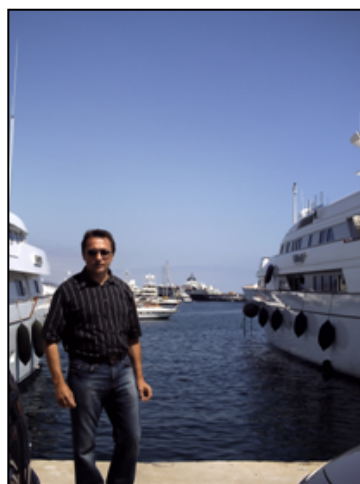
Diesen edlen Liegeplatz hat unser Schatzmeister schon mal für den Club ins Visier genommen – doch dafür sind die Finanzen zu knapp.

Finanzpolster sondern auch die clubeigenen Liegeplätze in diesen 20 Jahren von 2 auf 8 Plätze erhöht. Der Wert dieser Plätze ist für uns überlebenswichtig.