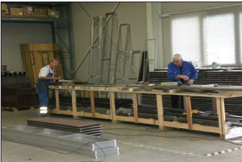
Vormontage der Auslegerroste