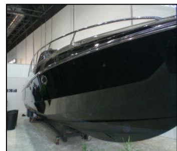
Schwarz, lang, stark.....

sich durch eine Multifunktionalität der Einbauteile äußert, die sich manchmal in geradezu verblüffender Einfachheit zeigt und das Boot damit zum absoluten Formwandler macht. Das sind zum einen Sitzbänke die man in diversen Möglichkeiten von der einfachen Sitzbank zur 2 x 2 Meter-Liegefläche wandeln kann oder Sitze, die als Teil einer Sitzgruppe heraus zu einzelnen Steuersitzen geklappt werden. Kurz gesagt die Bootbauer sind momentan wirklich bemüht, mit absolut neuen Innenraum-Konzepten das ehemals starre Innenleben der Boote zu revolutionieren und das bei immer mehr Booten mit Erfolg an Raum und Nutzgewinn. Auch außen an den Booten ändert sich zumindest mal die Farbe. Das klassische weiß und blau der letzten Jahrzehnte wird durch ein