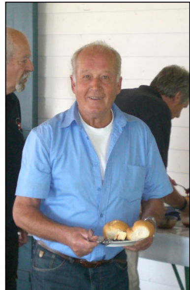
MYCR-Mitglieder in Aktion

bleibt zu hoffen, dass die gemeinsame Veranstaltung auch in den kommenden Jahren von den Mitgliedern so gut angenommen wird und in Zukunft zur Traditionsveranstaltung der beiden Vereine wird, bei der Segler und Motorbootfahrer in „fröhlicher Runde“ einen gemeinsamen Abend am See verbringen.