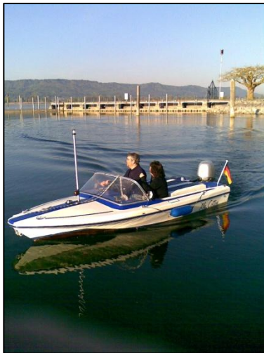
Letztes Foto des seit Herbst vermissten Motorboots

Seit Herbst wird vom stolzen Besitzer nach dem sehr schön restaurierten Motorboot gesucht. Zuletzt wurde es im Spätsommer in unserem Hafen gesichtet.