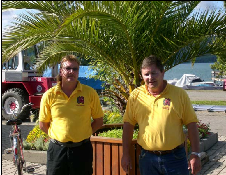
Die beiden Hafenmeister vom Hafen Sipplingen

Wie bereits zu Anfang erläutert, ist die Person des Hafenmeisters in jedem Hafen besonders wichtig. Diesem Umstand wurde in Sipplingen besonders Rechnung getragen und diese Position mit zwei äußerst netten und freundlichen Herren besetzt, die quasi stets für alle Hafenslieger und natürlich den Gästen da sind. Ich persönlich fand es besonders gut, dass die Herren durch ihre T-Shirts zu erkennen waren. Ich meine wer kennt das nicht, dass man in einem fremden Hafen erst mal auf die Suche nach dem Hafenmeister geht ohne zu wissen wie er aussieht und manchmal völlig Fremde Menschen fragt, wo denn der Hafenmeister sei. Außerdem hatte ich selten so einen freundlichen und entspannten Umgang mit Hafenmeistern erlebt wie