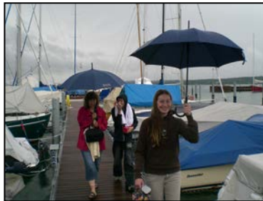
Immer nur lächeln

gab es zwei Häfen, die von unseren Booten angelaufen wurden. Der eine Teil steuerte Richtung Schweiz in den Hafen von Altnau, die anderen fuhren im Konvoi nach Konstanz bzw. stießen am Abend dazu.