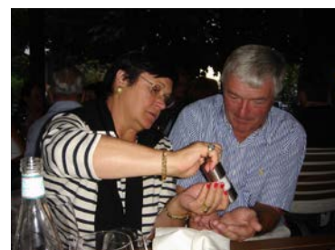
Salz ist gut für den Mineralhaushalt

dies kann soweit führen, dass die fehlenden Salze, wie hier abgebildet, in letzter Minute in großen Mengen von Hand nachgeführt werden müssen. Was im Extremfall passieren kann, wenn man diese Warnung nicht beachtet, sieht man hier.