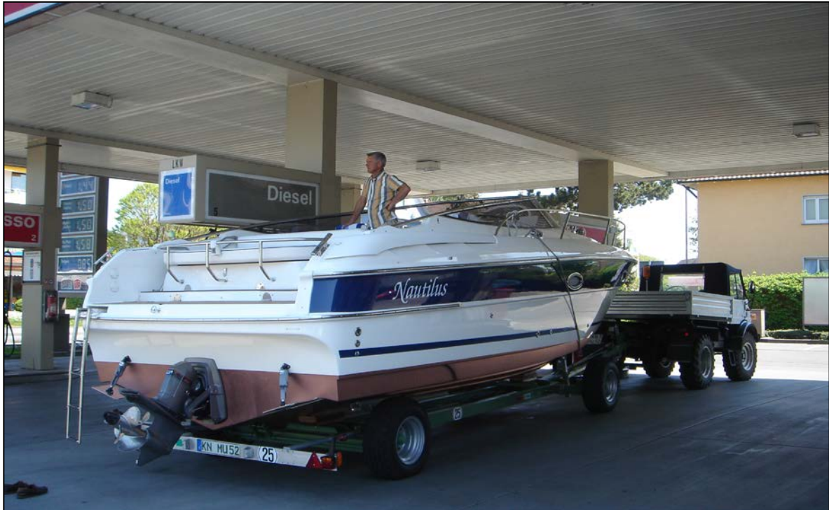
Schmerz und Resignation machen sich breit

Nichts desto trotz kann sich der hier abgebildete Eigner offensichtlich einen vollen Tank leisten, wenngleich seinem Gesichtsausdruck der Schmerz und die Resignation anzusehen sind, mit der er den steigenden Preis an der Zapfsäule beobachtet.