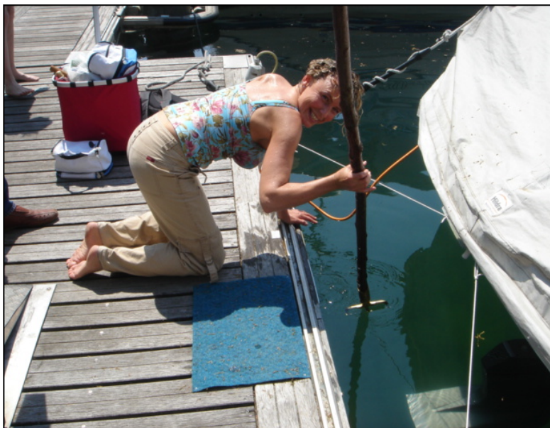
Der Augenblick der Bergung ( Szene nachgestellt)