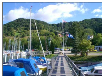
Blick Richtung Land

Direkt neben dem Hafen hat die Gemeinde Sipplingen übrigens ein sehr schönes öffentliches Schwimmbad eingerichtet. In dem mit einem Reetdach versehenen Gebäude am Eingang des Bades befindet sich ein Kiosk für Eis und Pommes (die kosten da nur 1,50 €) kalte Getränke und dergleichen. Im inneren des Gebäudes ist ein Restaurant im rustikalen Stil untergebracht mit großer Terrasse und Blick zum See hinaus, in dem man auch sehr gut und vor allem günstig Essen kann.