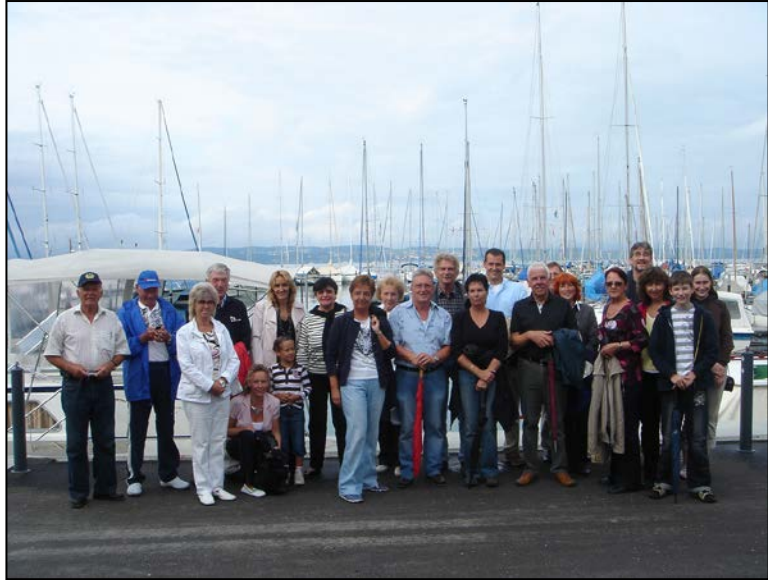
Gruppenbild im Hafen mit mehreren gutaussehenden Damen

Da sich nicht alle Teilnehmer der mehrtägigen Ausfahrt auf ein gemeinsames Ziel für den Freitag einigen konnten,