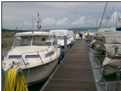
Da weht er der MYCR Wimpel

Das Petrus uns nicht immer wohl gesonnen sein kann, haben wir vom MYCR im Jahr 2008 erfahren können. In all den letzten Jahren hatten wir mit unseren Ausfahrten immer Glück beim Wetter, ja manchmal waren unsere Ausfahrten die einzigen Sonnentage in der Woche, aber dieses Jahr hat es schon bei der ersten großen Ausfahrt nach Bottighofen mit dem unsteten Wetter angefangen. Bottighofen in der Schweiz glänzte zwar mit vorerst vielen Anmeldungen, welche dann aber durch die schlechte und unge-wisse Wetterlage wieder zurückgezogen wurden. Aber wie immer, sind es die Clubmitglieder, die immer dabei sind, die aus unserer 3 Tages Ausfahrt dann doch noch ein großes Fest werden ließen. Obwohl die Wettervorhersage für den Freitag und Samstag nicht Gutes hoffen ließen, haben sich immerhin acht Boote aufgemacht den Wimpel des MYCR in den Obersee zu tragen.